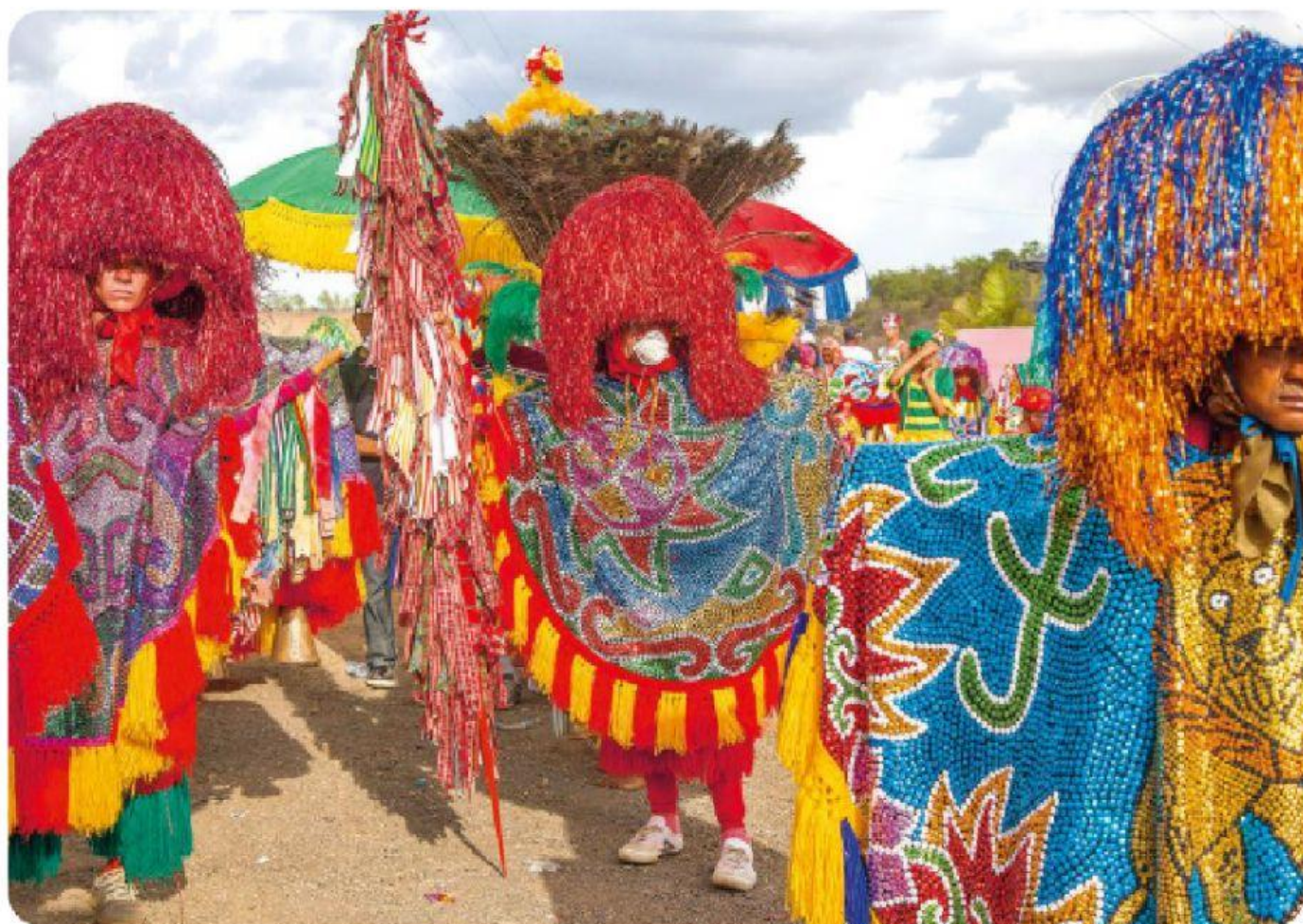
Apresentação de Maracatu do Baque Solto, na zona rural do estado de Pernambuco, 2015.

A música dentro dessa manifestação é de extrema importância, pois carrega em si a herança cultural do continente africano. Por toda essa importância histórica e de representatividade, o maracatu é considerado Patrimônio Imaterial Cultural do Brasil.