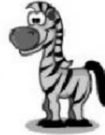
Zebra – Zebra

TEMPO ESTIMADO PARA REALIZAÇÃO: ___1h___