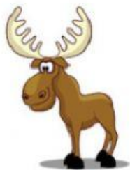
Moose – Alce