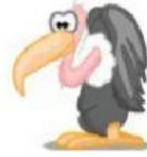
Vulture – Urubu