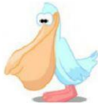
Pelican – Pelicano