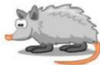
Mouse – Rato