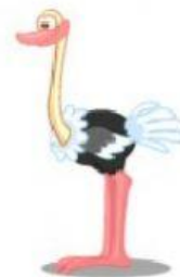
Ostrich – Avestruz