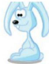
Rabbit – Coelho