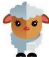
Sheep – Ovelha