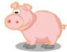
Pig – Porco