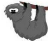
Sloth – Bicho-preguiça