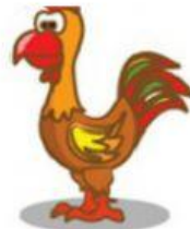
Rooster – Galo