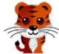
Tiger – Tigre