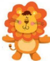
Lion – Leão