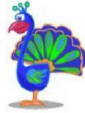
Peacock – Pavão