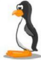
Penguin – Pinguim