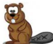
Squirrel – Esquilo