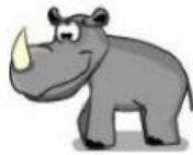
Rhino – Rinoceronte