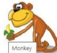
Monkey – Macaco