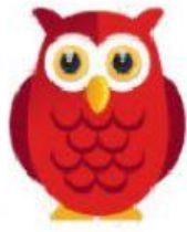
Owl – Coruja