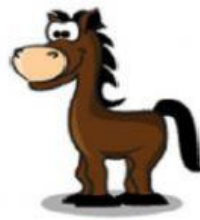
Horse – Cavalo