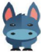
Donkey – Burro