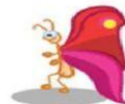
Butterfly – Borboleta