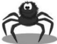
Spider – Aranha