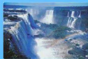
Parque Nacional do Iguaçu