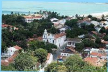
Cidade de Olinda