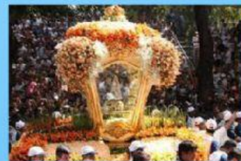
Círio de Nazaré