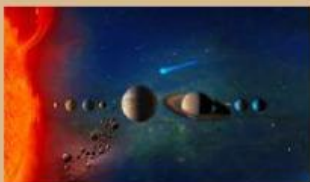
Pergerakan benda langit