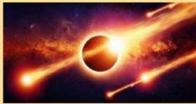
Terjadi Hari Kiamat

Takdir mubram adalah ketetapan Allah Swt. yang sudah pasti terjadi dan tidak dapat diubah oleh manusia. Takdir ini merupakan ketentuan mutlak dari Allah yang berlaku bagi setiap makhluk.