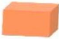
Khối hộp chữ nhật