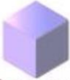
Khối lập phương

1. Tích vào khối lập phương/khối hộp chữ nhật