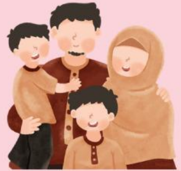
Menyayangi kedua orang tua