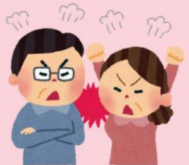
Tidak mematuhi orang tua