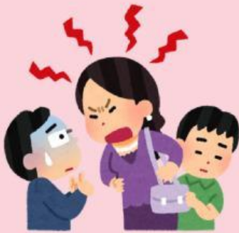
Membuat orang tua marah