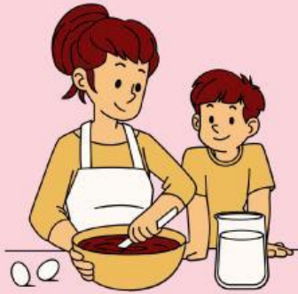
Membantu ibu di rumah

Berilah tanda ✗ Pada perilaku yang tidak benar !