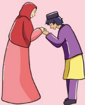
Berpamitan sebelum pergi