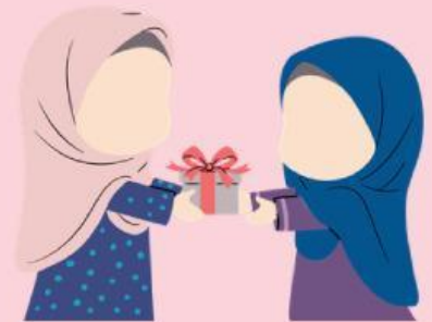
Memberi hadiah ke orang tua