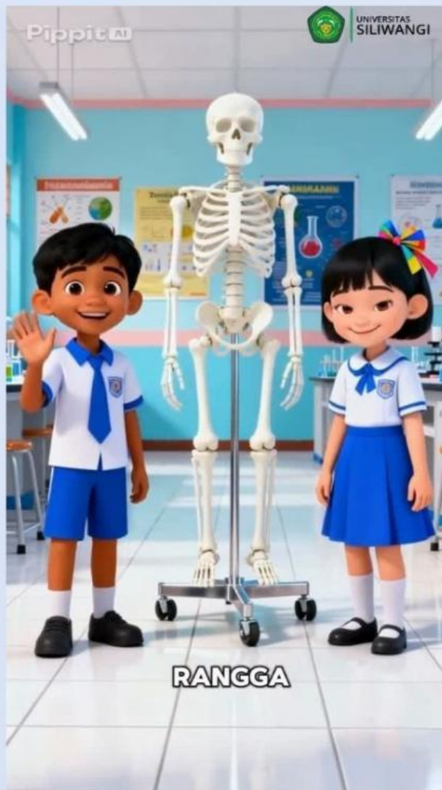
Video 1. Penguatan Materi "tulang"

Tontonlah video berikut untuk memperkuat pemahaman mu terkait materi tulang!