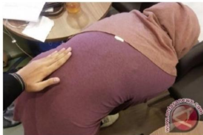
Gambar 3. Ilustrasi kasus skoliosis

Rabu, 8 November 2023 15:44 WIB • waktu baca 3 menit