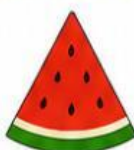
Miếng dưa hấu