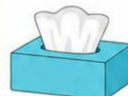
Hộp khăn giấy