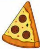
Miếng bánh pizza