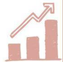
Tabel Analisis Faktor Penyebab Kelangkaan BBM

Jelaskan pengertian kelangkaan dalam ilmu ekonomi. Hubungkan dengan kasus BBM di atas menggunakan kalimatmu sendiri!