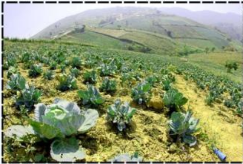
Gambar A Daerah pegunungan dengan perkebunan sayur