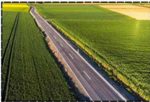
Gambar B Dataran rendah dengan sawah yang luas

Andi tinggal di daerah pegunungan, tetapi ia ingin bekerja sebagai nelayan. Apakah pekerjaan tersebut sesuai dengan kondisi wilayah tempat tinggalnya? Mengapa?