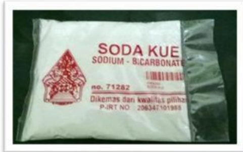
Gambar 1. Natrium Bikarbonat