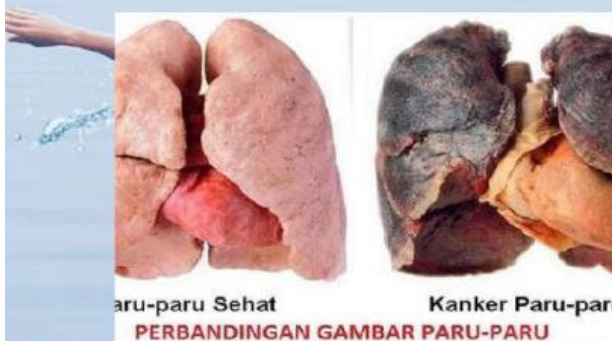
Gambar 22. Perbandingan paru-paru sehat dan kanker paru-paru

Terjadi akibat peradangan pada saluran bronkus yang bisa dipicu oleh infeksi virus atau bakteri serta paparan iritan seperti asap rokok dan polusi udara.