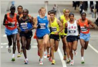
Gambar 23. Lari