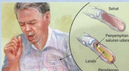
Gambar 21. Ilustrasi saluran bronkus normal dan bronkitis