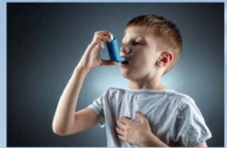
Gambar 20. Penggunaan inhaler pada penderita asma

Penyempitan saluran pernapasan (bronkus dan bronkiolus) akibat pembengkakan dan kontraksi otot polos (bronkospasme).