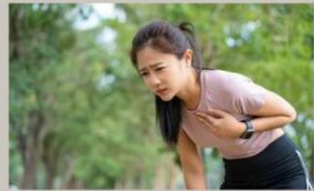
Gambar 24. Seorang perempuan yang mengalami sesak napas.

Menurut Ananda apakah perbedaan antara kedua gambar di atas? Sesuaikan dengan konteks yang dibahas di kegiatan 4.