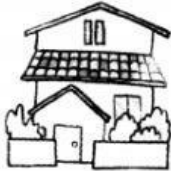
a. いえ ie