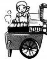
c. やたい yatai