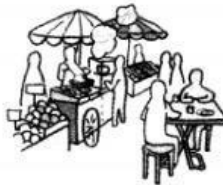
e. いちば ichiba