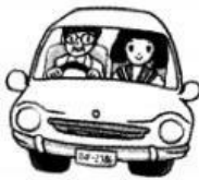
d. くるまの なか kuruma no naka