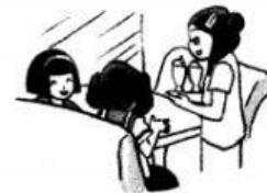
f. レストラン resutoran