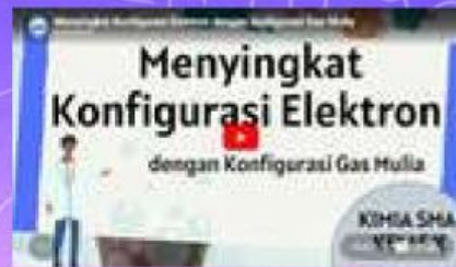
Video 2 Menyingkat Konfigurasi Elektron dengan Konfigurasi Gas Mulia