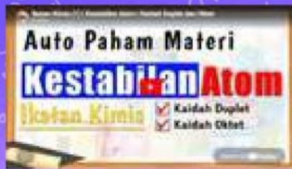
Video 1 Kestabilan Atom