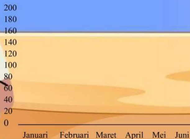
Diagram Garis: Penjualan Buku Koperasi Sekolah 2025

(Lengkapi diagram garis di atas sesuai gambar yang tersedia disamping)