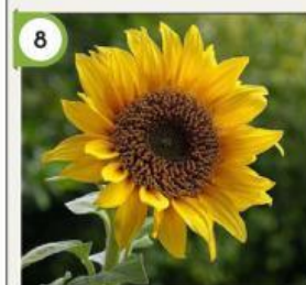
8 Bunga Matahari