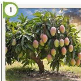
1 Pohon Mangga