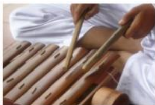
Video 2. Bilah pertama

1. Apa yang terjadi saat bilah bambu pada Gamolan dipukul?