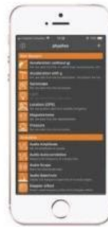
Gambar 2. Tampilan aplikasi phyphox

Cara memainkan gamolan dan penggunaan aplikasi: