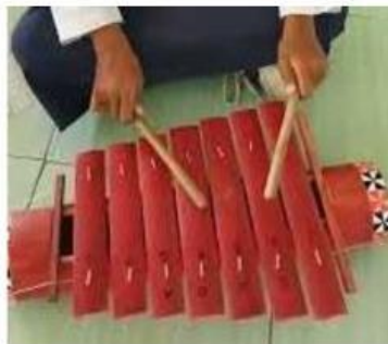
Animasi 1. Gelombang yang pukul

Kenapa gamolan berbunyi saat dipukul? Penasaran? Ayo, belajar mengenai konsep gelombang bunyi bersama-sama.