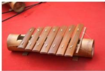
Gambar 1. Gamolan