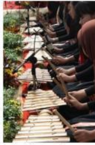
Gambar 1. Permainan gamolan

Setiap getaran tersebut dirambatkan oleh tali nilon yang tergantung dengan bantuan ganjal, menuju tabung/baluk di mana tali nilon terikat. Oleh tabung/baluk, getaran diubah menjadi gelombang yang kemudian disebarkan ke udara terbuka di sekitar gamolan. Tugas dari tabung/baluk adalah sebagai amplifikasi atau yang memperbesar volume suara, sama seperti resonator pada gitar.