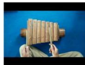
video 3. Bilah kedua

2. Perhatikan apa yang terjadi saat bilah pertama dan bilah kedua dipukul. Apakah perbedaan yang terjadi pada bunyi yang dihasilkan?