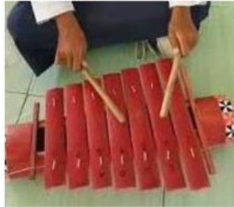
Video 1. Gamelan yang dipukul

Cobalah untuk mengamati video berikut ini