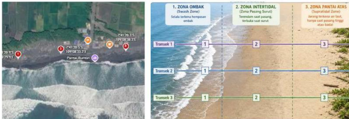
Gambar 4. Rute dan Ilustrasi Transek Pengamatan

Berdasarkan karakteristik hewan di atas, amati peta dibawah ini sebagai dasar untuk memperkirakan keberadaan mereka.