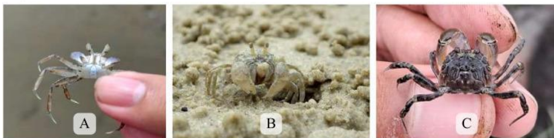
Gambar 3. A) Kepiting hantu ( Ocypode kuhlii ), B) Kepiting gelembung pasir ( Scopimera dotilla ), C) Kepiting gelembung pasir ( Scopimera globosa )

Ocypode kuhlii mempunyai karapas yang hampir membulat dengan warna badan jingga keunguan bermotif bintik putih yang kasar. Pada spesies jantan mempunyai alat reproduksi khusus di bagian bawah tubuhnya, sedangkan betinanya mempunyai perut yang lebih besar. (Syaravicena dkk, 2023) Scopimera dotilla dan Scopimera globosa mempunyai kemiripan morfologi, dimana spesies jantan mempunyai capit lebih besar dan perut kecil dibandingkan betinanya, karapasnya berbentuk bulat yang berwarna mirip pasir seperti putih, abu-abu, atau kecoklatan. (Adhani dkk, 2018)