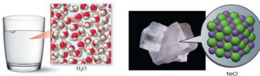
Gambar 1. Air dan Kristal garam dapur (Tro, 2011)

Setiap zat di alam tersusun atas partikel-partikel sangat kecil berupa atom. Atom-atom tersebut tidak selalu berada dalam keadaan bebas, melainkan saling berikatan membentuk partikel yang lebih besar. Pada senyawa kovalen berupa molekul, sedangkan pada senyawa ion dinyatakan dalam satuan rumus. Ikatan yang terjadi antaratom inilah yang disebut ikatan kimia. Ikatan kimia memungkinkan atom-atom mencapai keadaan yang lebih stabil sehingga terbentuk berbagai macam zat dengan sifat yang berbeda-beda.