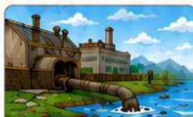
Pembuangan limbah pabrik ke sungai secara terus-menerus.

Perhatikan permasalahan di bawah ini! Tarik (drag) pernyataan pada kolom kanan ke dalam kategori yang tepat sesuai dampaknya bagi daur air.