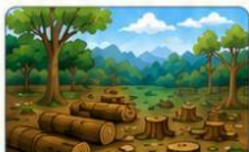
Penebangan hutan di daerah hulu sungai.