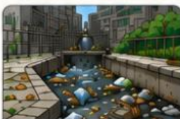
Sampah plastik menyumbat saluran air.