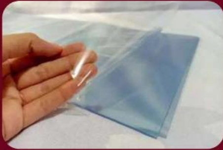
Gambar Plastik Mika