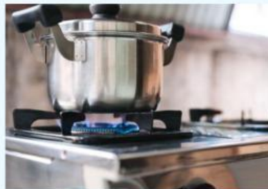
Gambar 2 Pembakaran gas LPG

https://kimbo.id/storage/uploads/W8GqnZpznX4zWfgqlbfoyyf7amGGqYFKzHYApKYZ.jpg