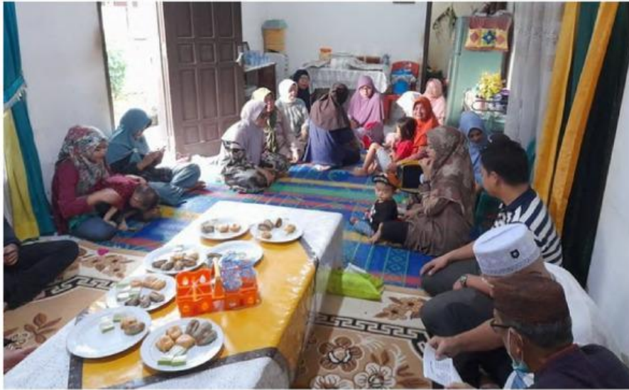
Gambar Tradisi Pantauan

Perlu dipahami bahwa tradisi pantauan bunting tidak hanya dilakukan di Pagar Alam, tetapi juga ditemukan di wilayah lain yang merupakan bagian dari budaya Besemah, seperti daerah Lahat, Empat Lawang, hingga sebagian wilayah Muara Enim. Hal ini menunjukkan bahwa tradisi tersebut merupakan identitas budaya yang lebih luas dari masyarakat Besemah, bukan hanya milik satu daerah saja. Penyebaran ini terjadi karena kesamaan latar belakang budaya, bahasa, dan sistem adat yang dimiliki oleh masyarakat di wilayah-wilayah tersebut.