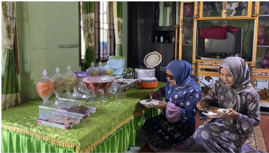
Gambar Tradisi Pantauan

Sementara itu, tuan rumah sering kali tidak ikut makan agar pengantin merasa lebih nyaman saat menikmati hidangan. Tradisi pantauan bunting memiliki makna sosial yang sangat kuat dalam kehidupan masyarakat Besemah. Tradisi ini tidak hanya menjadi bagian dari rangkaian pernikahan, tetapi juga berfungsi sebagai sarana mempererat hubungan silaturahmi antarwarga. Selain itu, pantauan juga mencerminkan nilai kepedulian sosial, di mana masyarakat secara bersama-sama menunjukkan perhatian dan dukungan kepada pasangan pengantin yang memulai kehidupan baru.