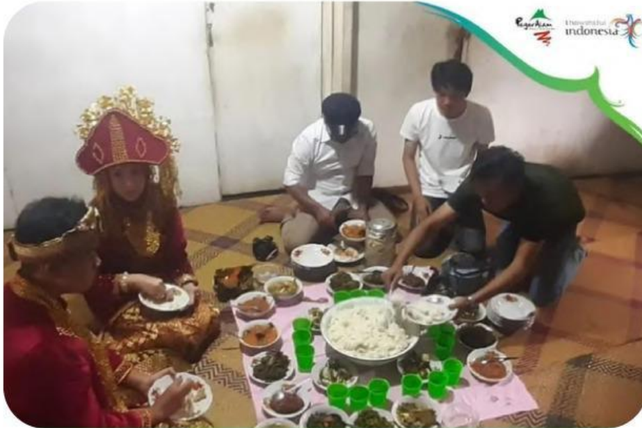
Gambar Tradisi Pantauan

Tradisi pantauan bunting merupakan salah satu adat pernikahan yang masih dilestarikan oleh masyarakat Besemah di Pagar Alam dan wilayah sekitarnya. Tradisi ini berupa kegiatan menjamu pasangan pengantin di rumah-rumah warga sebagai bentuk penghormatan dan kebersamaan, pantauan dilakukan dengan cara pengantin mendatangi rumah warga yang telah mengundang, kemudian tuan rumah menyambut dan menyuguhkan berbagai hidangan makanan. Tradisi ini biasanya dilaksanakan setelah akad nikah, baik pada hari yang sama maupun menjelang atau sesudah resepsi pernikahan, tergantung kesepakatan keluarga dan masyarakat setempat.