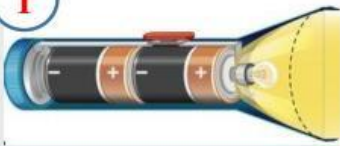
Đèn pin bật sáng