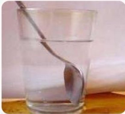
Gambar (1) es mencair

Untuk mengawali kegiatan dalam pembahasan kalor, kalian harus mengamati gambar dibawah ini