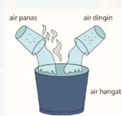
Gambar (2) air mendidih