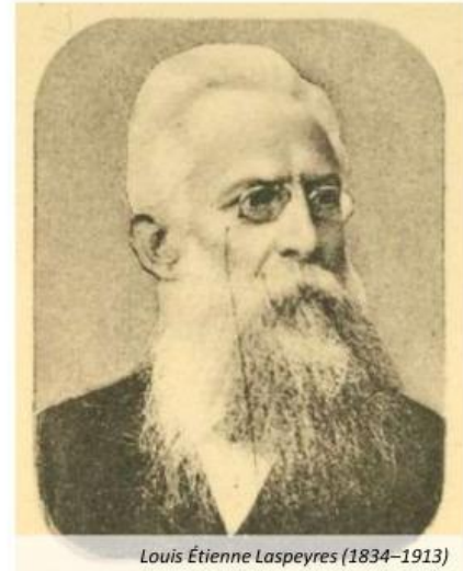
Louis Étienne Laspeyres (1834–1913)

Secara umum, ada dua metode untuk menghitung indeks harga, yaitu metode agregatif tidak tertimbang dan metode agregatif tertimbang.