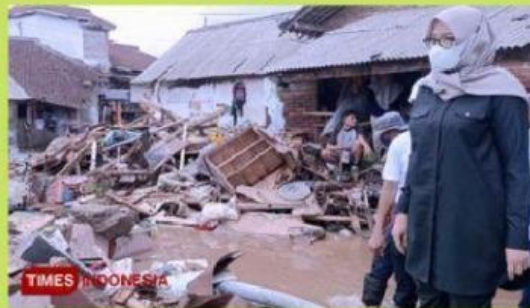
Banjir di Kalibaru

https://timesindonesia.co.id/peristiwa-daerah/435086/gercep-pemkab-banyuwangi-evakuasi-korban-banjir-bandang-kalibaru