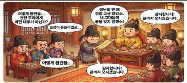
자신의 지지세력 우대