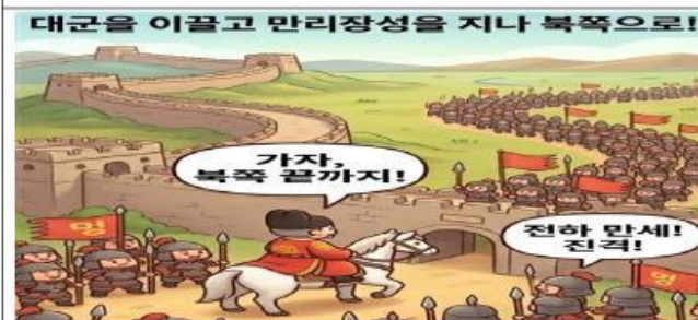
명나라의 국력을 강화