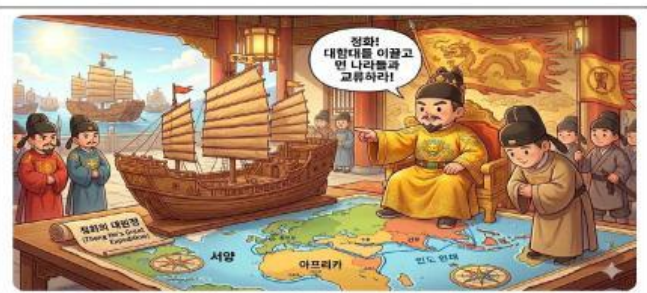
조공 무역 확대를 위한 정책