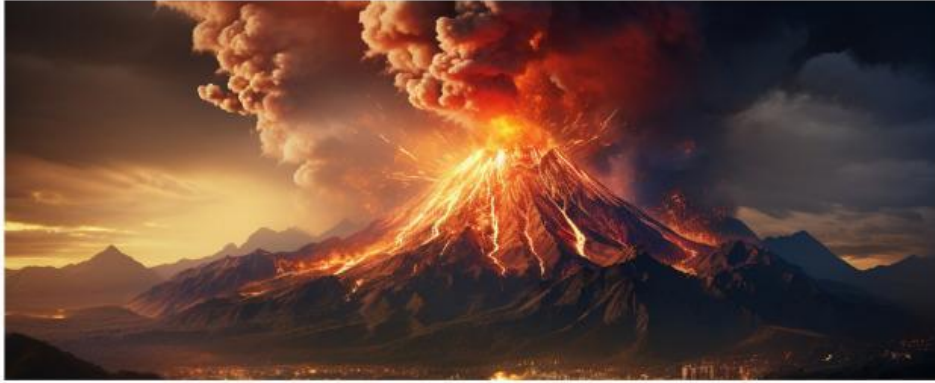
Gunung Marapi Erupsi Tahun 2023

Pada awal Desember 2023, hujan deras mengguyur kawasan Gunung Marapi, Sumatera Barat, setelah gunung tersebut beberapa kali mengalami erupsi. Tumpukan pasir, batu, lumpur, dan abu vulkanik di lereng gunung terbawa aliran air hujan menuju sungai-sungai yang berhulu di Marapi. Akibatnya terjadi banjir lahar dingin yang melanda beberapa daerah seperti Kabupaten Agam, Tanah Datar, Padang Panjang, dan sekitarnya. Aliran lahar dingin merusak sawah, kebun warga, jembatan, serta menutup sebagian aliran sungai dengan material vulkanik. Banyak tumbuhan liar di bantaran sungai tertimbun lumpur dan pohon-pohon kecil tumbang terbawa arus. Warga juga melaporkan berkurangnya ikan air tawar seperti ikan gariang dan ikan nila yang biasanya hidup di sungai tersebut karena air menjadi keruh, dangkal, dan tercemar material abu. Di sisi lain, beberapa bulan setelah kejadian, mulai tumbuh rumput liar, semak belukar, dan tanaman pionir di lahan bekas endapan lahar. Serangga seperti belalang dan kupu-kupu mulai terlihat kembali. Hal ini menunjukkan bahwa ekosistem berusaha pulih secara alami, meskipun membutuhkan waktu yang lama. Peristiwa ini menunjukkan bahwa bencana alam dapat memengaruhi keanekaragaman hayati pada tingkat gen, jenis, maupun ekosistem di wilayah Sumatera Barat.