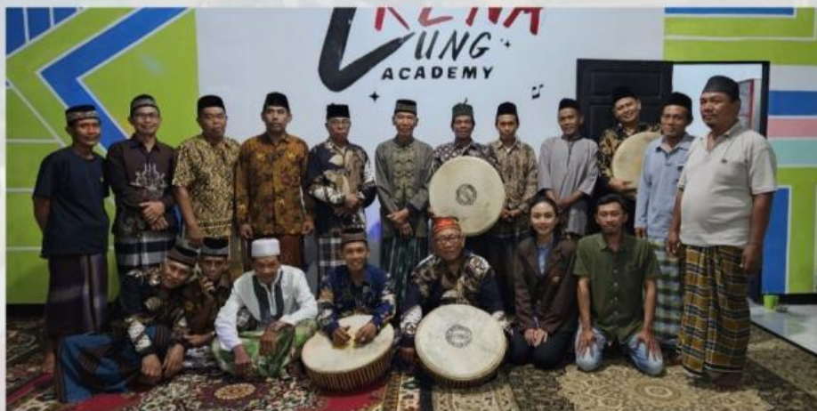
Gambar 3. kebersamaan setelah pertunjukan Seni Dendang Bengkulu Selatan

Perilaku sopan penampil, tata cara berpakaian, dan sikap penonton selama pertunjukan menggambarkan nilai-nilai agama yang dijunjung tinggi masyarakat.