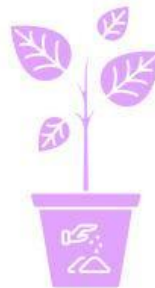
Додавання дерев'яної золи