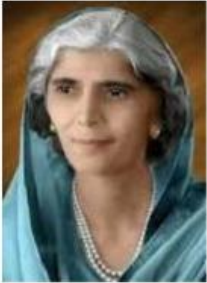
لیاقت علی خان