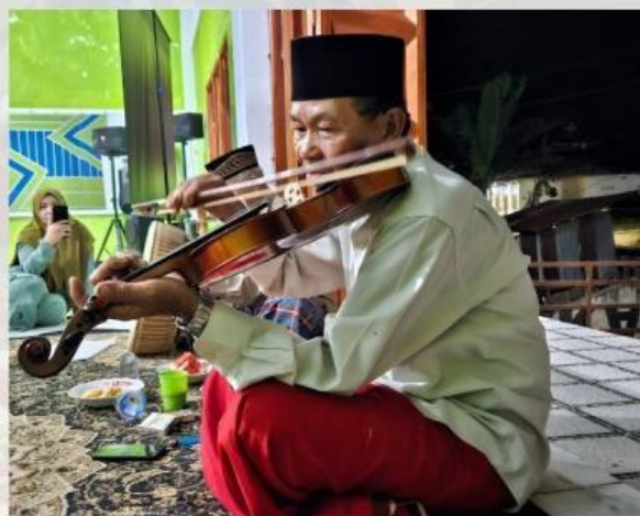
Pemain Biola Pada Pertunjukan Dendang