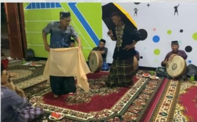
Tari Pulau Pinang