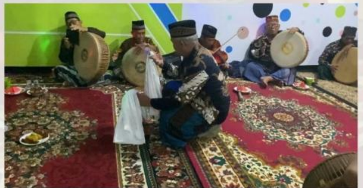
Tarian pada Pertunjukan Berdendang Mutus Tari