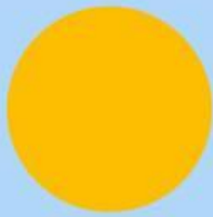
Gambar 4. Lingkaran