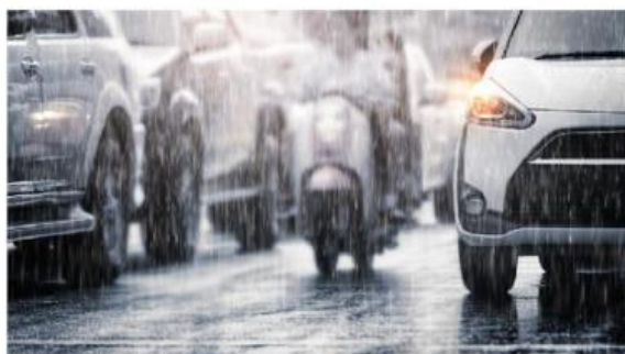
Gambar 1. Hujan Asam

Hujan secara alami bersifat agak asam, semakin bertambahnya konsentrasi polutan di udara dapat meningkatkan nilai keasaman. Kegiatan transportasi berperan besar terhadap penurunan kualitas udara. Berdasarkan Badan Pusat Statistik, luas wilayah kota Pontianak sebesar 118,31 km 2 dengan jumlah penduduk 658.685 jiwa. Laju pertumbuhan penduduk pada tahun 2020 sebesar 1,81%. Jumlah kendaraan yang berada di kota Pontianak pada tahun 2020 mencapai 31.853 unit. Banyaknya penduduk di kota Pontianak menyebabkan kebutuhan sarana transportasi meningkat sehingga dapat meningkatkan konsumsi bahan bakar yang dapat menimbulkan pencemaran udara. Emisi gas SO 2 dan NO 2 yang berasal dari kegiatan industri dan transportasi, merupakan penyebab terjadinya peristiwa hujan asam apabila emisi gas tersebut bereaksi dengan air hujan. Secara alami derajat keasaman (pH) air hujan normal yaitu 5,6. Air hujan merupakan salah satu sumber air bersih di Pontianak sehingga kualitasnya perlu diperhatikan dengan seksama.