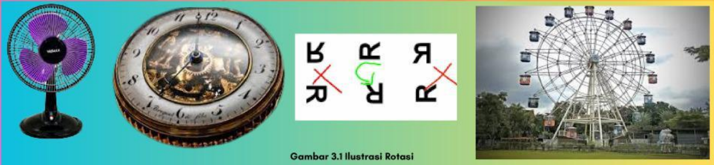
Gambar 3.1 Ilustrasi Rotasi