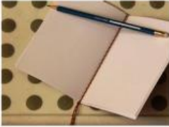
Táto fotografia od