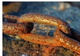
Gambar 2. Besi berkarat

https://images.app.goo.gl/XZ6biGmhX7PW2Hk96