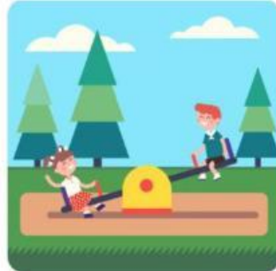
Gambar 4. Permainan jungkit-jungkit