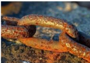
Gambar 6. Besi berkarat

Minuman berkarbonasi adalah minuman yang mengandung gas karbon dioksida ( \text{CO}_2 ) yang dilarutkan dalam air dengan tekanan tinggi. Dalam kondisi ini, gas \text{CO}_2 dapat bereaksi dengan air membentuk zat baru yaitu asam karbonat ( \text{H}_2\text{CO}_3 ). Namun, zat ini juga dapat berubah kembali menjadi air dan gas karbon dioksida. Di dalam larutan, asam karbonat bisa bereaksi lebih lanjut dan menghasilkan ion-ion lain seperti \text{HCO}_3^- dan \text{CO}_3^{2-} . Ketika botol minuman dibuka, tekanan berubah dan gas mulai muncul dalam bentuk gelembung. Perubahan ini menunjukkan bahwa sistem dalam minuman tersebut tidak hanya berlangsung satu arah saja.