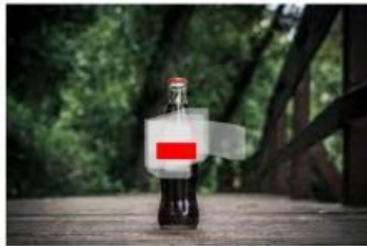
Gambar 1. Minuman Berkarbonasi