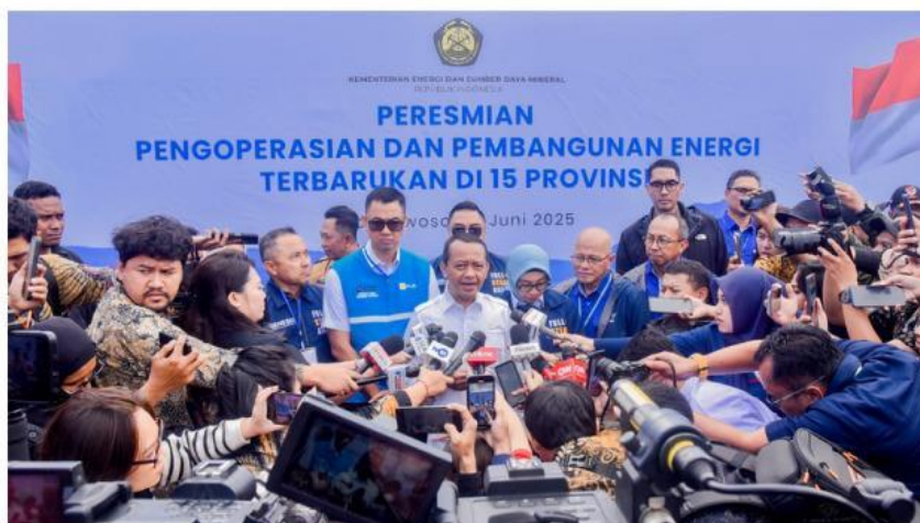
Gambar 2.1: Pemerintah Targetkan 5600 Desa Teraliri Listrik Dalam 5 Tahun