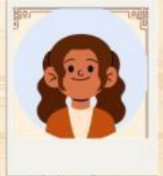
Chân dung học sinh