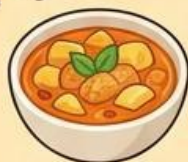
แกงมัสมั่น