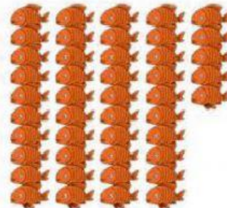
45 ekor ikan