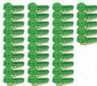
35 ekor ulat