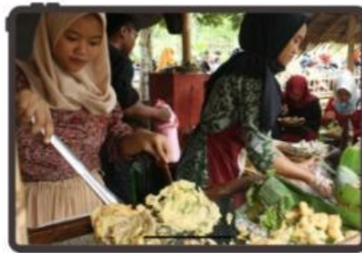
Gambar 3. Sentra penjual tempe mendoan