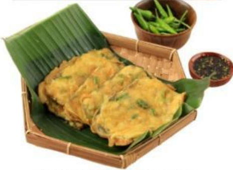
Gambar 1. Tempe Mendoan Khas Banyumas

Banyumas memiliki ciri khas yang menjadi identitas daerahnya. Dari segi sosial dan budaya, Banyumas dikenal dengan berbagai potensi seperti bahasa daerah, kebiasaan masyarakat, makanan khas, serta seni budaya. Salah satu makanan khas Banyumas adalah mendoan.