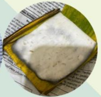
Gambar 4. Tempe mendoan dengan kulit ari