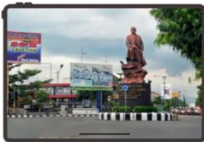
Gambar 2. Kabupaten Purbalingga