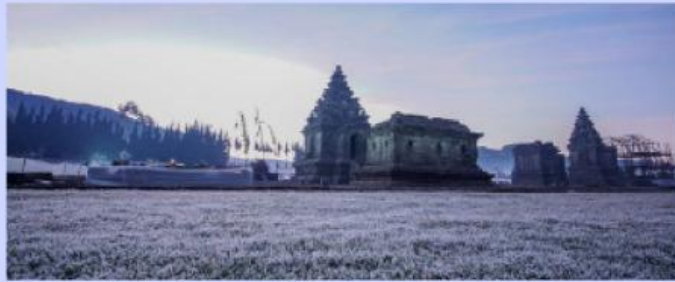
Embun upas di Kawasan Candi Arjuna

Pernahkah kalian melihat daun atau rumput di dataran tinggi tertutup lapisan es tipis pada pagi hari? Mengapa air embun yang awalnya cair bisa berubah menjadi es saat malam hari, lalu mencair kembali ketika terkena sinar matahari? Dari mana es tersebut mendapatkan kalor saat mencair? Fenomena ini menunjukkan bahwa perubahan wujud zat memerlukan kalor, meskipun suhu zat tidak selalu berubah selama proses tersebut berlangsung.