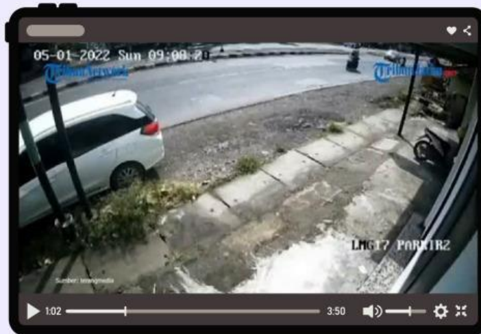
Video 1 Kecelakaan Lalulintas, Sebuah Bus Banting Stir