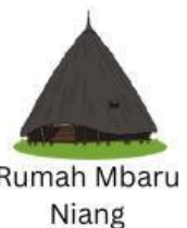
Rumah Mbaru Niang