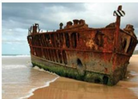
Gambar 2. korosi pada besi

Pernahkah kamu melihat atau mendengar peristiwa ledakan? Reaksi pada peristiwa ledakan berlangsung sangat cepat, bahkan dalam hitungan detik atau kurang dari satu detik. Kecepatan reaksi yang sangat tinggi inilah yang menyebabkan terjadinya ledakan. Lalu, apakah semua reaksi kimia selalu berlangsung secepat ledakan?