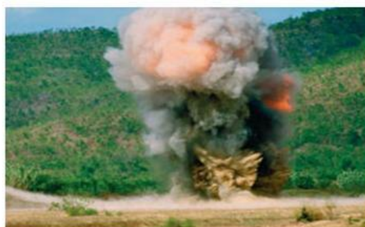
Gambar 1. Ledakan

Pernahkah kamu melihat atau mendengar peristiwa ledakan? Reaksi pada peristiwa ledakan berlangsung sangat cepat, bahkan dalam hitungan detik atau kurang dari satu detik. Kecepatan reaksi yang sangat tinggi inilah yang menyebabkan terjadinya ledakan. Lalu, apakah semua reaksi kimia selalu berlangsung secepat ledakan?