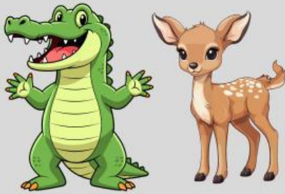
Si kancil dan buaya

Berilah tanda centang pada judul cerita di bawah ini yang merupakan cerita fiksi !