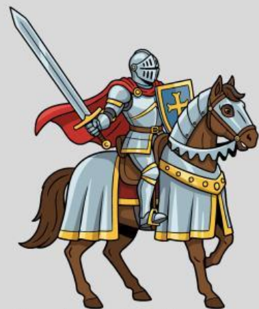
Ksatria dan kudanya