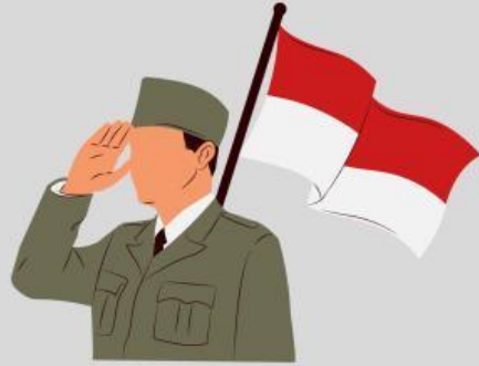
Sejarah Kemerdekaan Indonesia