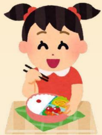
Makan makanan bergizi