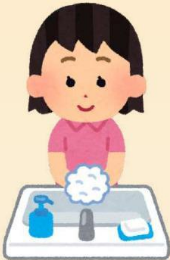
Mencuci tangan sebelum makan

Perhatikan gambar dan tulisan di bawah ini. Baca dan cobalah praktikkan dalam kehidupan sehari hari. Kemudian jawablah pertanyaan dibawah sesuai dengan gambar dan bacaan.