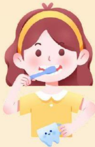
Menggosok gigi setelah makan