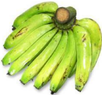
pisang ambon lumut

1. Amati gambar berbagai jenis buah pisang berikut.